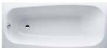
Vana 170×75 cm