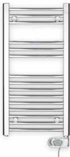
Koupelňový radiátor 906×500 cm