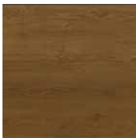
Dub tmavě hnědý