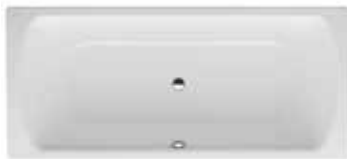
Vana 180×80 cm