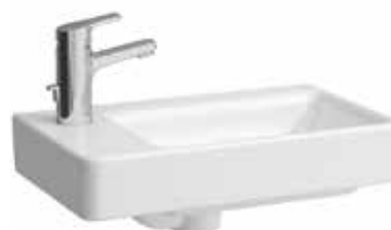
Umývátko 48×28 – levé