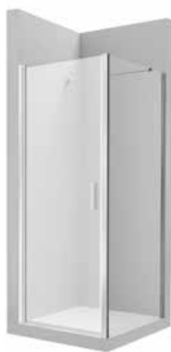
Otevíravé dveře 900 mm