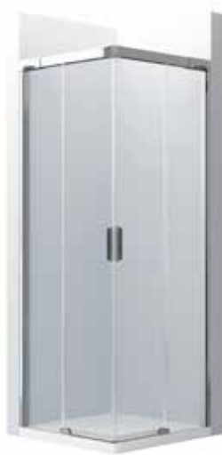
Posuvné dveře „přes roh“ 900 mm