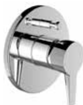
Baterie vanová, sprchová – Val