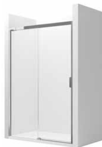
Posuvné dveře 1 000, 1 200, 1 400 mm