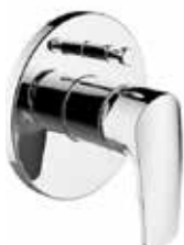
Baterie vanová, sprchová – Laurin technologie Studený start – systém úspory energie