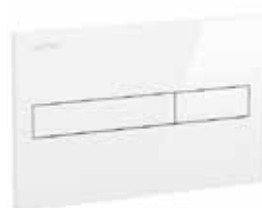
Splachovací tlačítko bílá